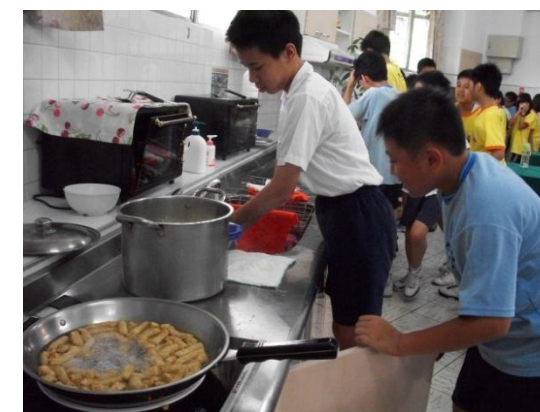
(男兒當自強，我也會做美味的料理)