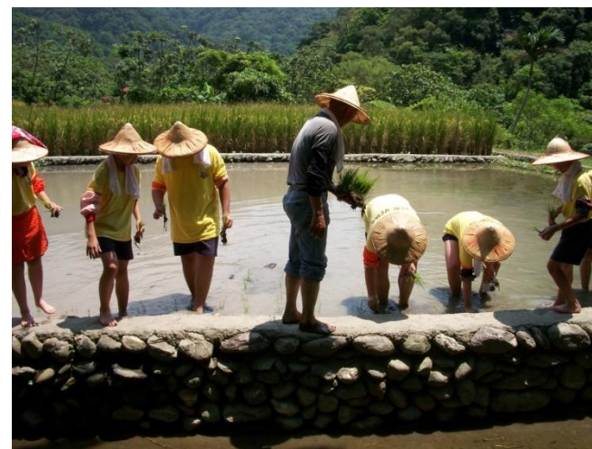
←(當我們同在田裡，其快樂無比！)