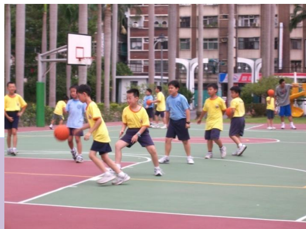
(體壇健將就是我，看我大顯身手！)