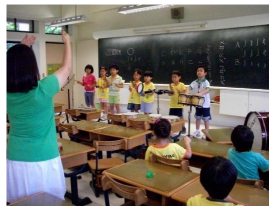
(ㄉㄨ ㄇㄨ ㄟ ㄇㄟ ... 音樂的世界真美妙!)