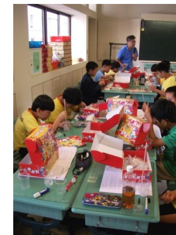
(在化學派對裡，我看到了神奇的鹽巴呵!)