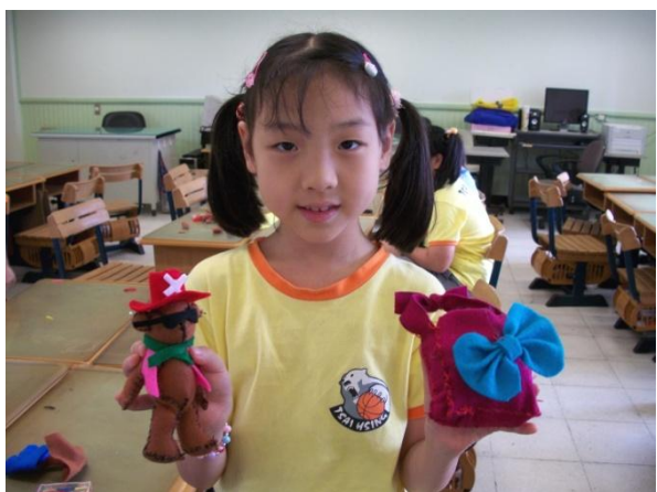
(厲害吧！我是縫紉小高手！)