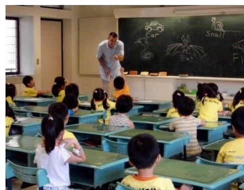
(蝙蝠、蝸牛……英文怎麼說呢?)

主題式校外教學依年級分別去了：頭城農場、綠世界、老鍋休閒農莊、宜蘭傳藝中心，讓城市孩子有機會體驗不同生活經驗。兩次校內活動，動用大批人力，將校園變成安全、有趣的遊戲區，在各班導師協助下，讓寶貝和好朋友们盡情的玩耍，一張張精彩的照片，留下童年美好的一頁。