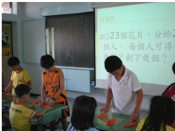
(數學金頭腦，任何問題考不倒)