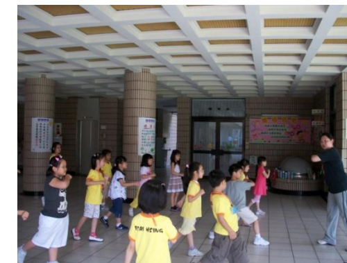
(抬抬手，踢踢腿，多多運動好健康)