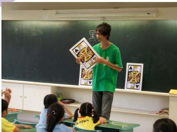
(魔法變變變，皇后如何變國王)