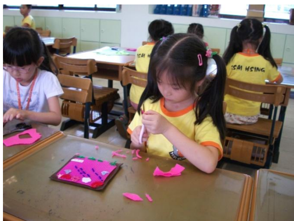
(動手玩創意，剪出一個美麗的世界)