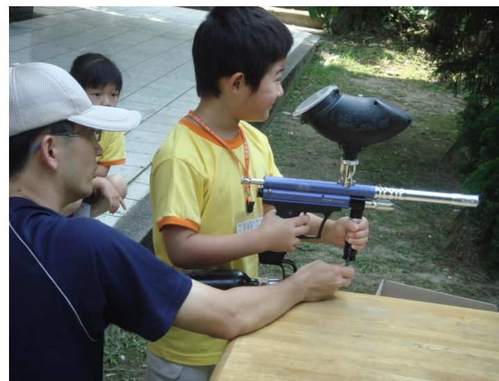
(瞄準目標，看我百發百中！)