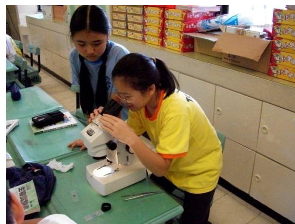
(細細瞧！微生物在做伸展操呢!)