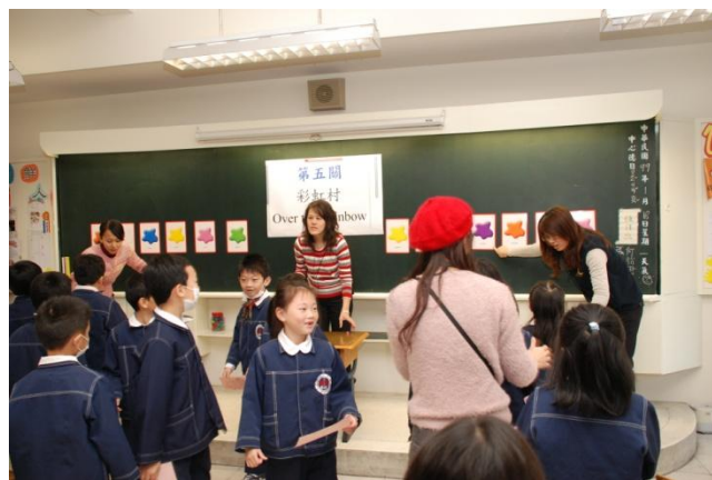
△ (What color is it?)

英語學習可以很「創意」、很「歡樂」。由小學部英語教師團隊設計的闖關活動，充分發揮英語教學的創意與成效，1 月 18 日在一年級全體小朋友期待中熱鬧舉行。共分成六個關卡——說說我是誰、母雞找小雞、字字珠璣、數字 123、彩虹村、句句屬實。小朋友們掩不住滿心雀躍，往過關地點衝鋒陷陣，在活動當中，個個發揮高度的興趣及個人英語的實力，一一通過六個關卡的考驗，為這次活動畫下完美的句點。