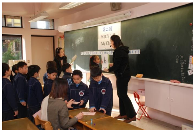
△ (考考你—英文大小寫)