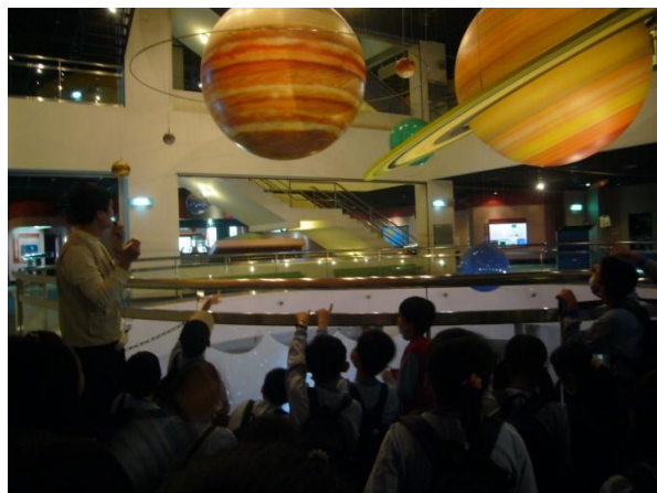
◀ (認真聆聽) ▲ (八大行星教學)