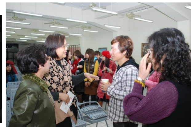
▲ (與老師們熱烈討論)