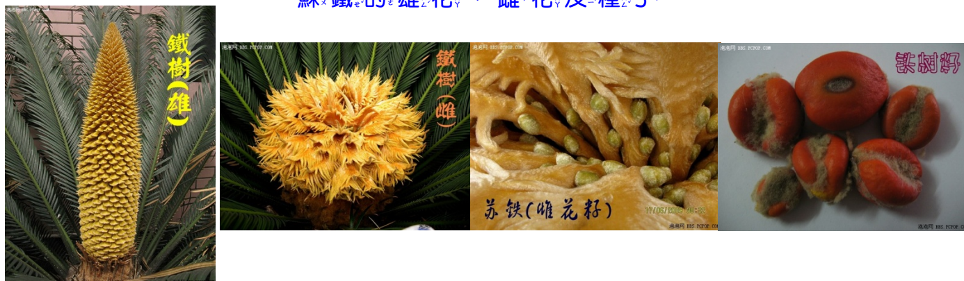
蘇鐵的雄花、雌花及種子

蘇鐵就是鐵樹，為常綠灌木，株高 2 ~ 5 公尺，樹幹短而粗，密生著落葉後的葉痕。一回羽狀複葉，幼時密被著淡黃色茸毛，老則光滑呈濃綠色，叢生莖的頂端，小葉線形，質硬，綠葉向後反卷。雖然常聽說「鐵樹不開花」，其實會開著雌、雄異株的單性花，雄花長圓錐形，狀如松毬；雌花自葉叢中抽出，圓錐形。種子為扁倒卵形，外種皮為朱紅色。蘇鐵的種子有毒，誤食生鮮的種子會引起抽筋、嘔吐、腹瀉和出血等症狀。