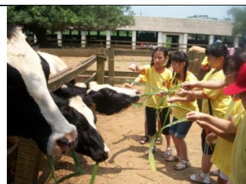
牛媽媽要多吃一點