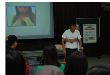
(哈姆立克急救法之指導說明)