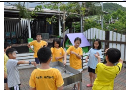
一起拉出七彩大泡泡