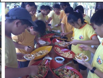
豐盛的自助式午餐