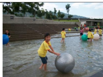
戶外戲水區：滾大球