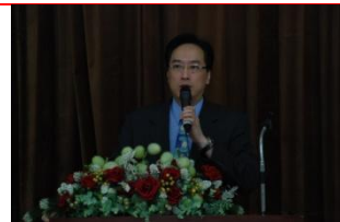
(幽默風趣的秦老師)