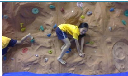
攀岩練習:抱石橫渡法