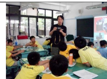
照過來!認識照相機