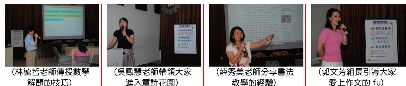
(林毓哲老師傳授數學解題的技巧)