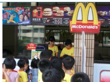
再興麥當勞-要用英文點餐喔