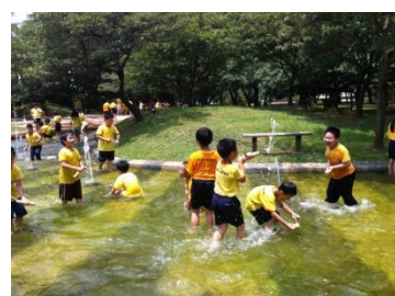
看我自製手工槍的厲害