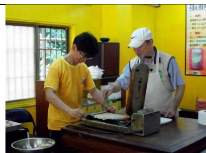
林老師示範捲蛋捲