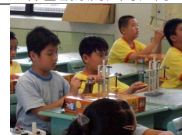
瘋狂科學:槓桿齒輪