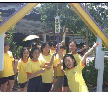
柚子樹下保「柚」平安