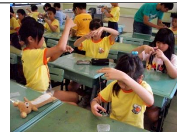
練習觀察力與專注力