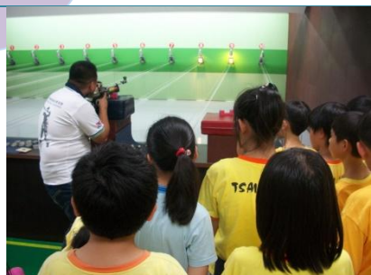
教練示範空氣槍的使用