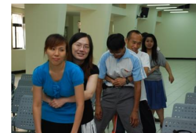
(老師分組實地演練)