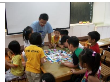
理財課:金融遊戲王卡