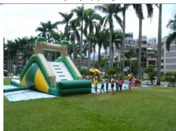
二層樓高的水溜滑梯