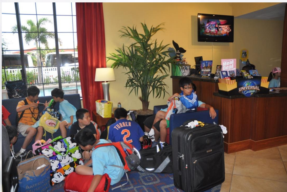
同學們打包好行李準備離開Orlando