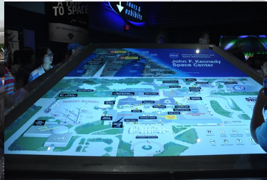
離開Orlando前先到甘迺迪航太中心參觀