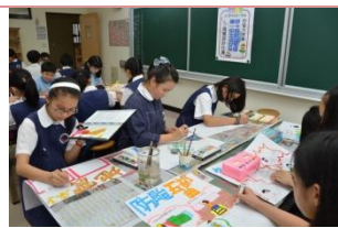
(四至六年級防災美勞比賽)