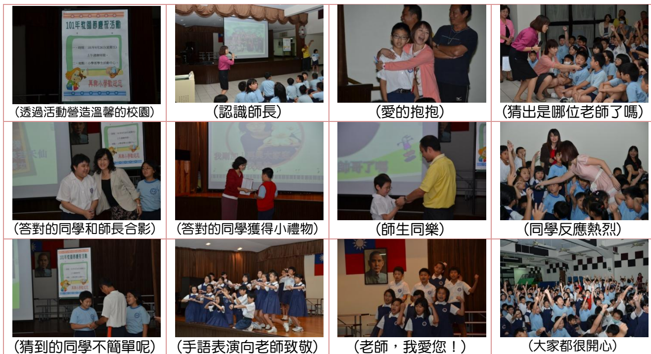
(透過活動營造溫馨的校園)