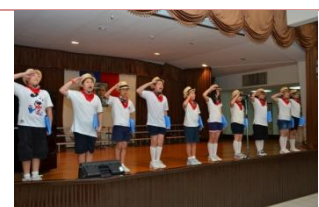
(鏗鏘有力的英語讀者劇場)