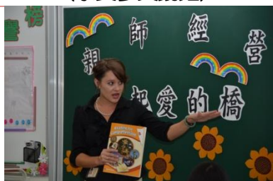
(外師報告教學理念)