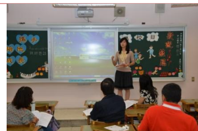
(科任教師介紹課程)