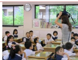
(各班進行防震演練前，老師示範說明)

✓ 依行政院於「國家防災日」推動「全國學生地震演習」，以「抗震保安，感動123」(一分鐘內所有參與者完成地震避難掩護動作；200萬以上學生一起動員參與；蹲下、掩護、穩住3個要領)為主軸，全國各級學校及幼兒(稚)園於9月21日早上9點21分同步實施地震避難掩護演練。