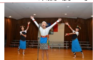
(唱作俱佳的卑南族歌唱)