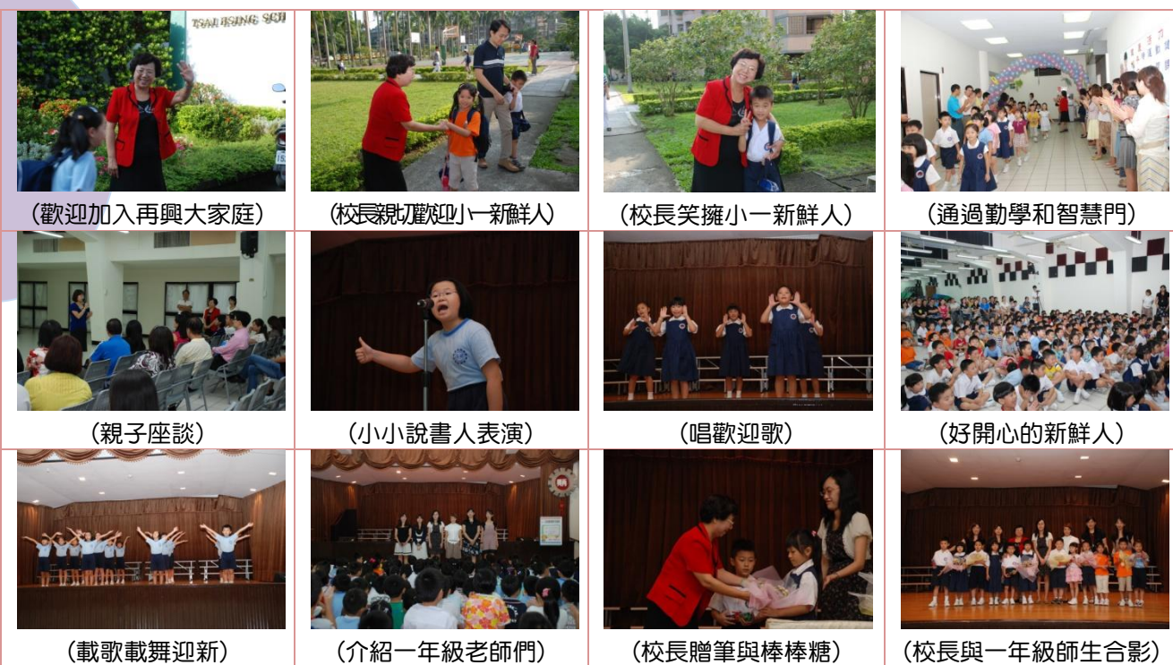
(歡迎加入再興大家庭)

開學日當天早晨，校長、老師們親切的迎接剛入學的新生，歡迎新生及隨同的家長。活動開始時由天使哥哥與寶貝姐姐以溫馨的氣氛帶領新生與家長，一起走「興光大道」進場，歡迎加入再興學校大家庭。新生通過勤學門時，摸一摸芹菜，象徵決心做個勤學努力的好學生。配合著擊鼓，希望學生都能鼓起勇氣挑戰任何困難，創造自己一片天地。接著由二年級學生唱歡迎歌歡迎新生、小小說書人表演、健康操表演。再來是校長、處室主任、導師、保健老師與新生相見歡。另外由校長贈送筆作為給新生的見面禮，盼望學生都能認真學習，為自己寫出一篇篇精彩的學習生活。活動最後與家長親師座談，協助新生家長了解學校作息，幫助孩子早日適應學校生活。