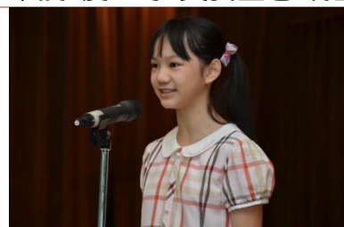
(六信陳品仔甜美的國語演說)