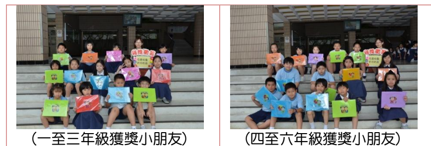
(一至三年級獲獎小朋友)

讓學生了解學校各項教育措施與教學活動，無論是課業學習、輔導管教與生活教育……教導孩子重視人文關懷、校園安全，目的在營造一個以學生為中心，溫馨優質的校園。