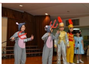
(氣勢十足的英語戲劇)