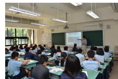
(互動式電子白板上課情形)