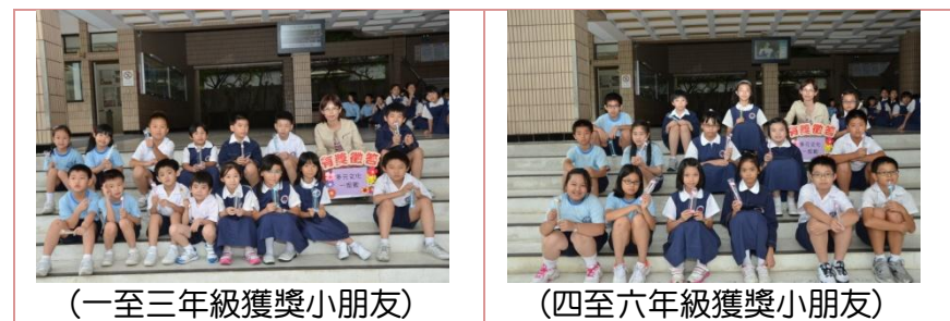
(一至三年級獲獎小朋友)

透過有獎徵答，讓學生對於不同的文化差異，具備更宏觀的地球村視野，並學會相互尊重、彼此包容，進而建構融合與和諧的多元社會。