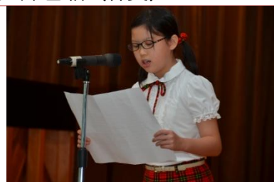
(五義林映漪優美的客家語朗讀)