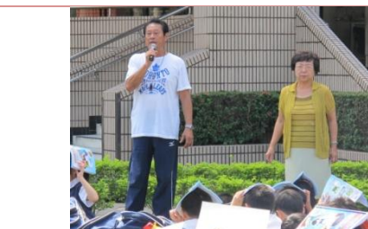
(校長和主任來為演練活動作檢查)