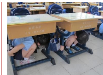
(地震發生時先就地掩護)