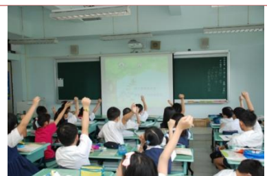
(同學熱烈參與支持)

➤ 101 學年度 9 月 23 日大校園開始開放，所有學生在下課時間在校園裡活動、打球，學生都能盡情舒展筋骨。