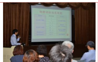
(陳主任說明課程規畫)