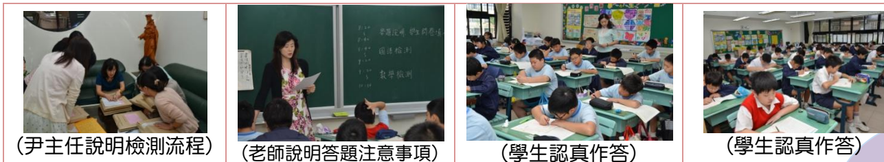
(尹主任說明檢測流程)

101 年度國民小學六年級基本學力測驗於 10 月 16 日舉行，此次檢測項目為國語文及數學，採普測及抽測兩種方式，學生們皆認真作答，希望能為校增光。