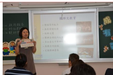
(導師介紹國語文教育)