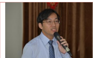
(中學部陳主任說明)