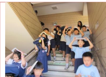
(進行疏散時保持冷靜)