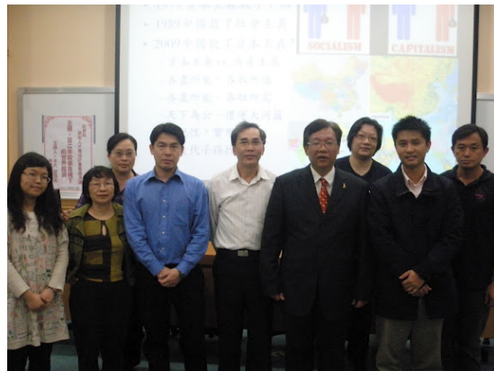
▲林教授和與會教師於演講後留影