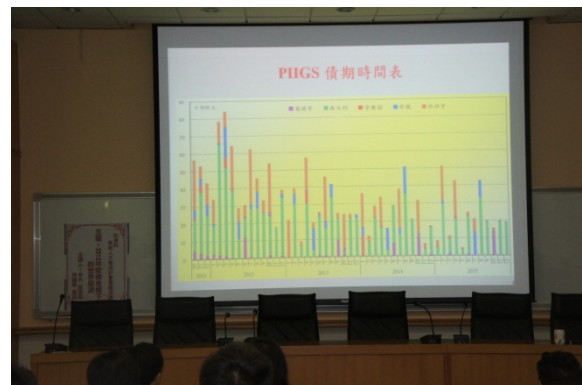
▲歐豬五國債其時間表