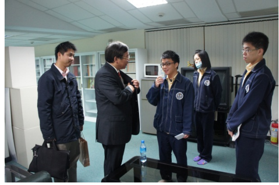
▲演講期間，教授與學生熱烈討論的情形。