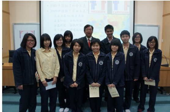
▲林教授和與會學生於演講後留影