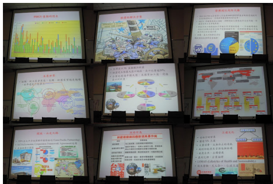
▲歐債原因及解決方案