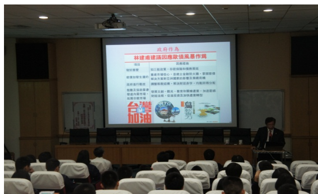
▲我國政府因應之道