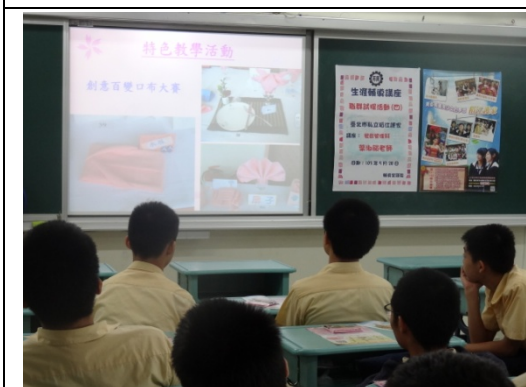
餐飲人也需要學習飯店事務