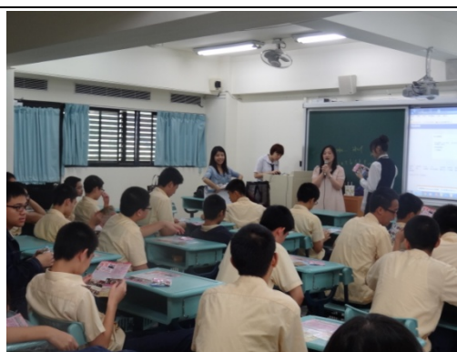
鼓勵大家一技在手、學有專精