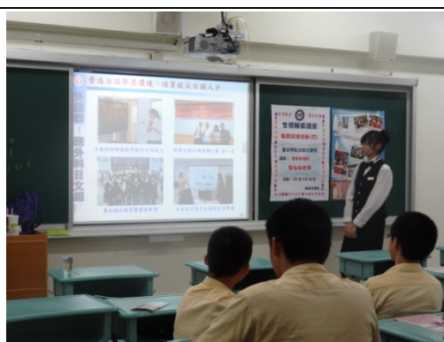
外語能力也是餐飲管理的學習重點