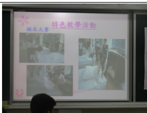
重視效率與服務的餐飲人